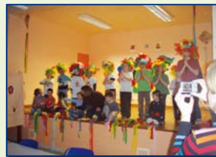
Spectacle donné par les enfants du Centre de Loisirs

C'est dans la bonne humeur que petits et grands ont assisté au spectacle organisé et présenté par les enfants et les animateurs du Centre de Loisirs de Normanville/St-Germain des Angles le vendredi 06 mars à la salle des fêtes de Normanville.