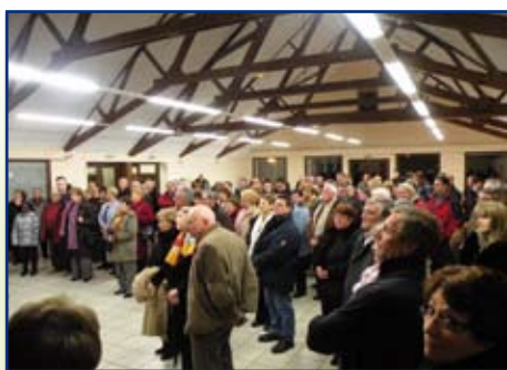
Une foule nombreuse venue pour partager ce moment de convivialité

Enfin, les lauréats 2008 du concours des maisons fleuries ont été récompensés. Nous souhaitons que les participants soient encore plus nombreux en 2009 et qu'ainsi, vous contribuez à l'embellissement et à la qualité de vie de notre village.