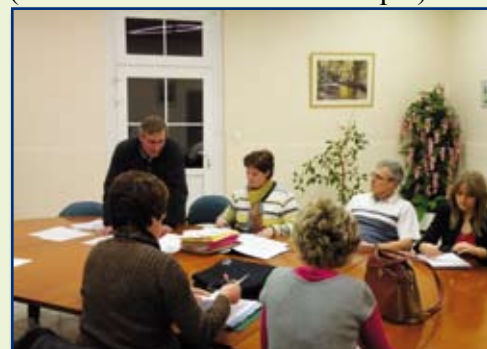
Réunion de la commission travaux pour définir les futures priorités 2008

8. Changement du compteur électrique (à l'extérieur du local technique).