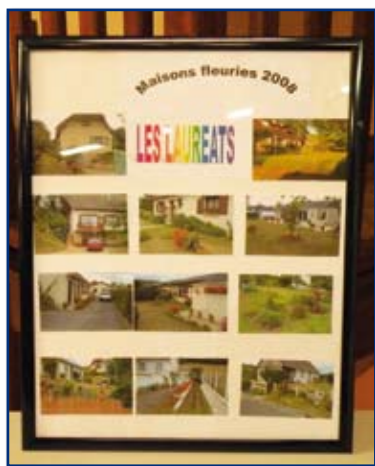
Les réalisations de nos lauréats