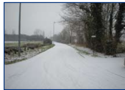
La Sibérie Normanvillaise

Cette rubrique est également la vôtre, vous pouvez y contribuer en nous envoyant par mail ( ev100@live.fr ) ou en déposant à la mairie vos jeux de chiffres ou de lettres, photos insolites de Normanville, recettes, etc.