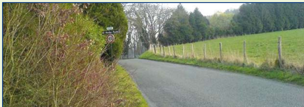
Les Hautes Portes

Le SPANC est le Service Public d'Assainissement Non Collectif. C'est lui qui a en charge la réalisation des contrôles obligatoires imposés par la loi sur l'eau de 1992.