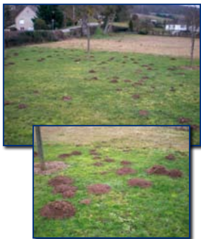
Les Tanpes attaquent !

Pour finir, le Conseil Communautaire a voté le budget, avec un accent important sur l'investissement, porteur d'avenir.